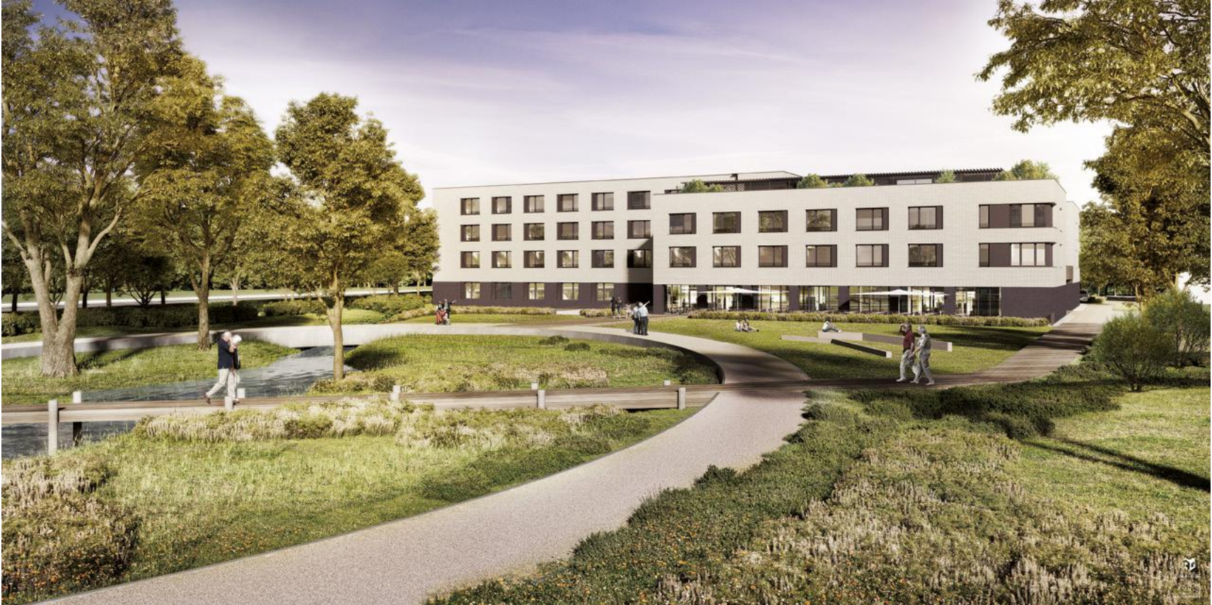
© FABECK Architectes - ARCO Architecture Company - Image3G