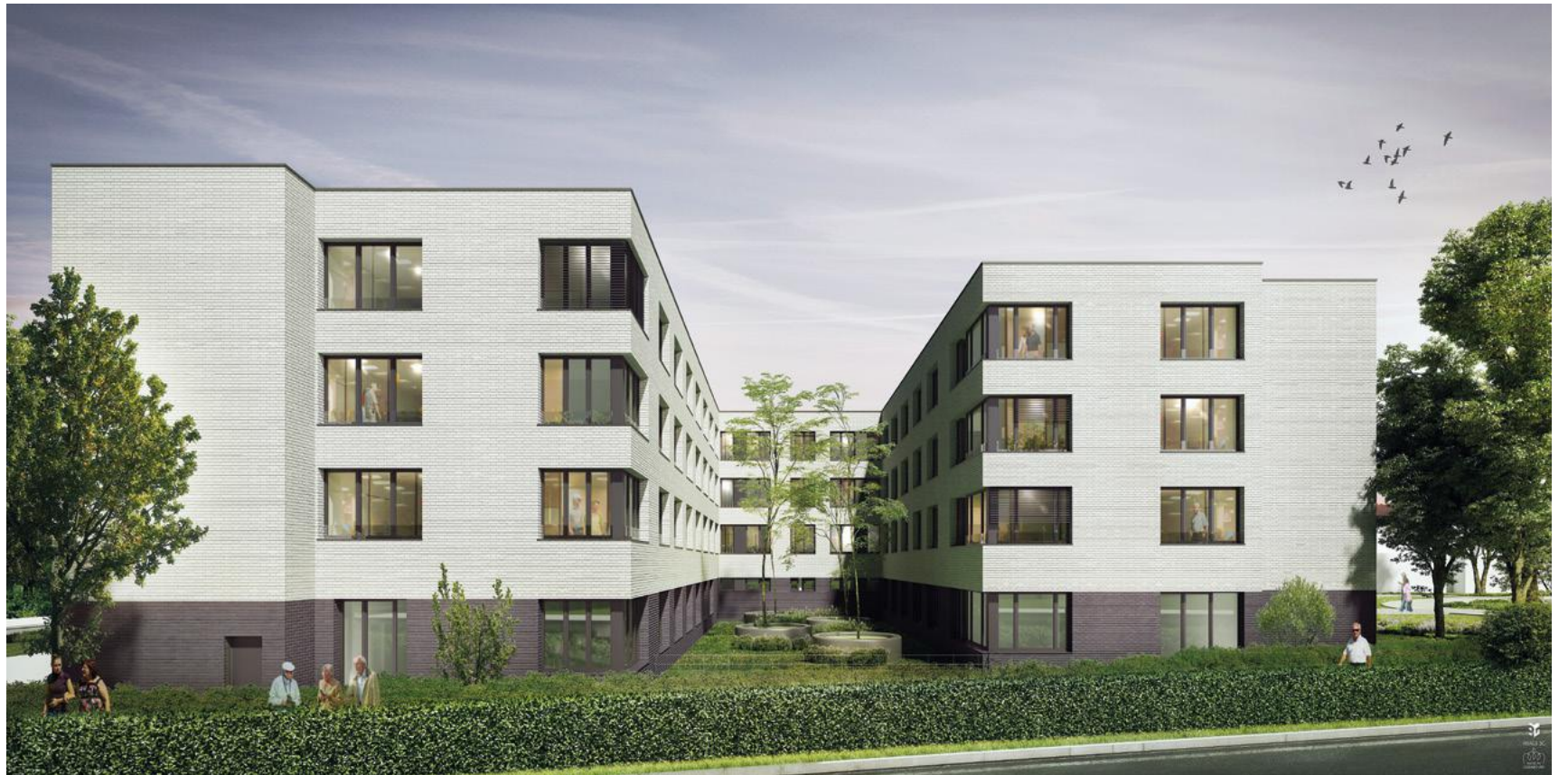
© FABECK Architectes - ARCO Architecture Company - Image3G