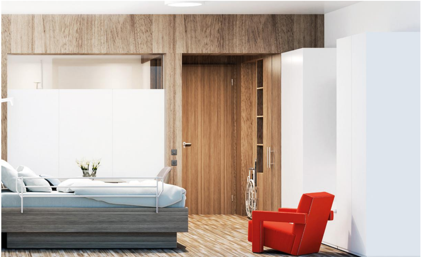
© FABECK Architectes - ARCO Architecture Company - Image3G