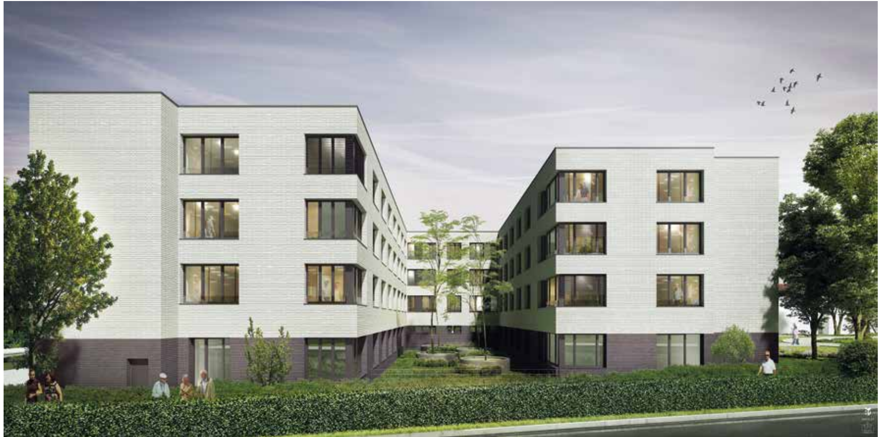
© FABECK Architectes - ARCO Architecture Company - Image3G