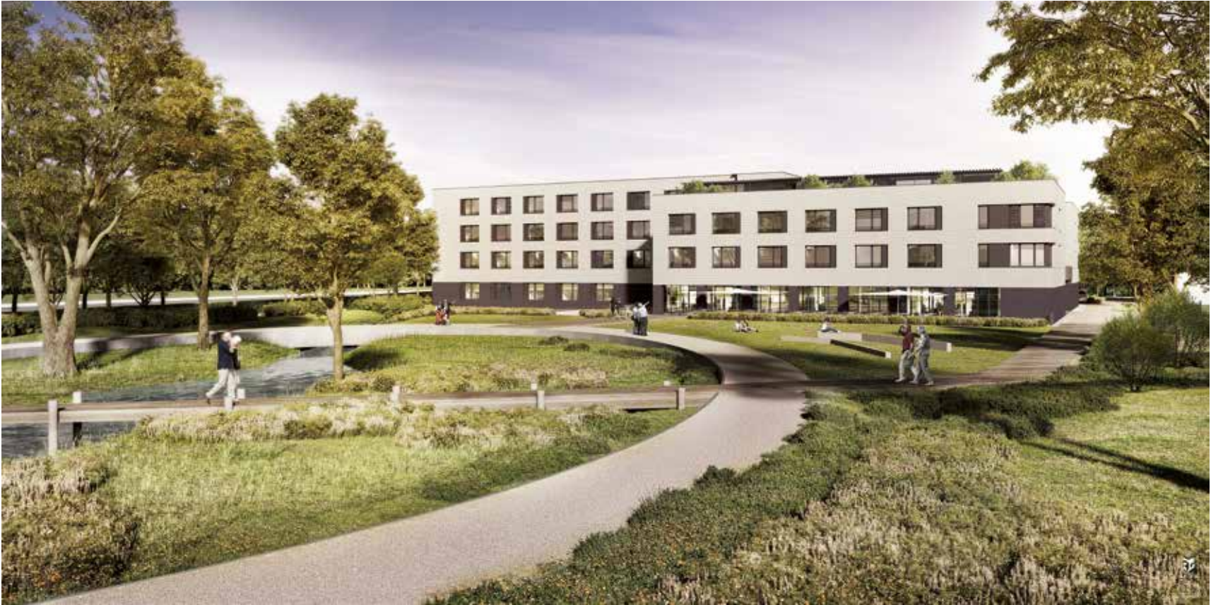
© FABECK Architectes - ARCO Architecture Company - Image3G