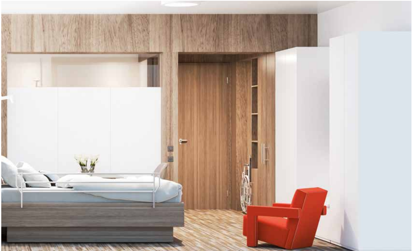
© FABECK Architectes - ARCO Architecture Company - Image3G