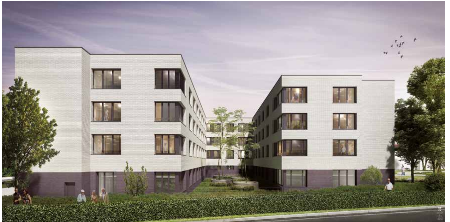
© FABECK Architectes - ARCO Architecture Company - Image3G