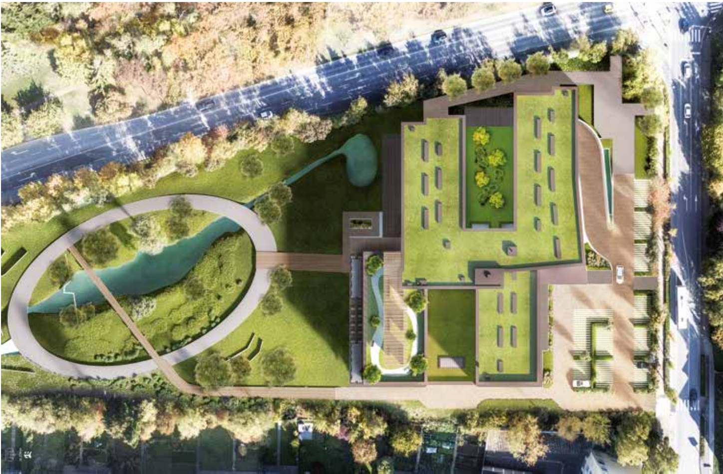
© FABECK Architectes - ARCO Architecture Company - Image3G